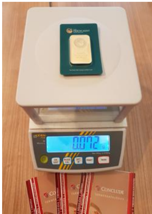
Arany valódiságvizsgálatára szolgáló mágnesmérleg

Az ultrahangos módszernél újabb módszer a hamis aranyak roncsolásmentes kiszűrésére a mágnesmérleg. Ez a módszer a színarany és a wolfram eltérő mágnesezhetőségén alapul. Az arany enyhén diamágneses (taszítja a mágneset), míg a wolfram paramágneses, így vonzza a mágneset. A mágnesmérleg egy olyan mérleg, amely egy nagy erejű mágneset tartalmaz a mérleg tetején, és ezzel van 0-ra beállítva (tárázva) a mérleg. Ha az aranyrudat vagy aranyérmét az erős mágneses tér fölé helyezik, akkor ez enyhén taszítani fogja a mágneset, ami ezáltal kissé nyomni fogja a mérleget, és ez így alacsony, pozitív értéket fog mutatni. Minden termékre jellemző egy adott méréstartomány. Az erre a célra kidolgozott táblázattal vetik össze a terméket a kereskedők. Ha szennyeződést vagy paramágneses zárványt (pl. wolframot) tartalmaz a termék, akkor a mágneset magához rántja a minta. A módszer ötvözeteknél kevésbé megbízható.