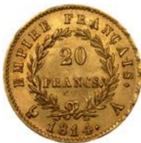
Bonaparte Napóleon érme