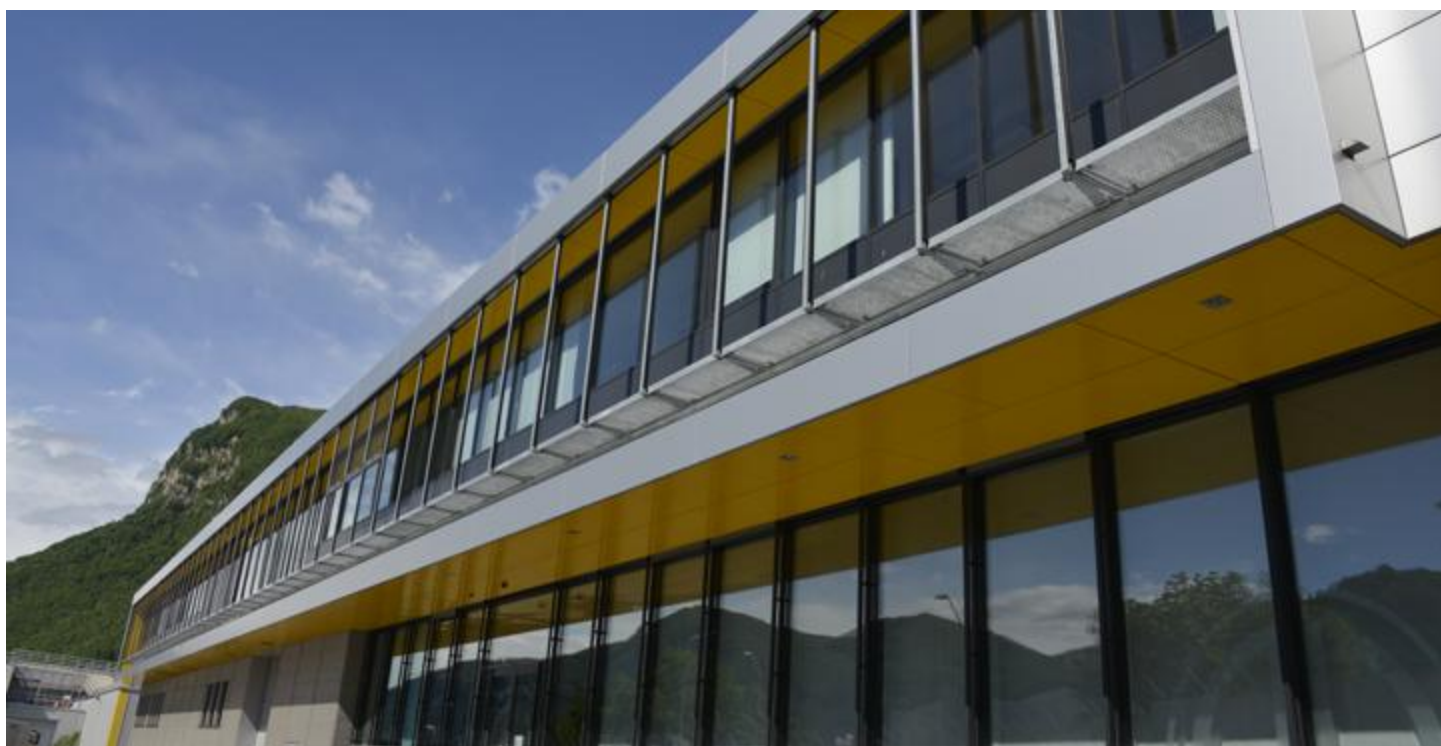
Az Argor-Heraeus irodaépülete Mendrisióban

A svájci Alpok lábánál elhelyezkedő Mendrisio nevű kisvárosban van a világ egyik legnagyobb aranyrúd gyártója az Argor-Heraeus üzem. Az eredetileg családi vállalkozásként induló cégben először a svájci UBS bank, majd a Commerzbank és a Münze Österreich szerzett tulajdonrészt, míg 2017-ben a Heraeus nevű német fémipari óriás vásárolta ki az összes tulajdonost, így immár a teljes Argor vállalatcsoport a Heraeusé lett.