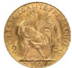
Francia „Kakasos” 20 frankos