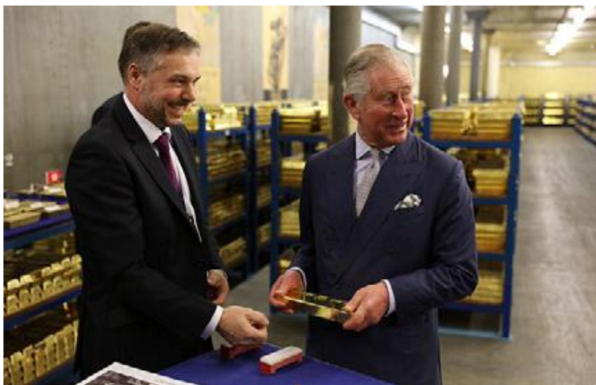
Károly herceg látogatása a Bank of England arany széfjében

A letétből bármilyen kis mennyiség kikérhető, viszont a ki- és betárolási díjat ki kell fizetni a trezorszolgáltató részére.