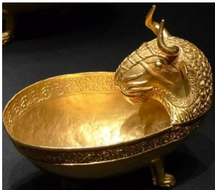
Bikaféjű ivóedény a nagyszentmiklósi kincsből

Mivel a nyugdíjak reálértéke minden várakozás szerint igen alacsony lesz – a demográfiai problémák miatt –, célszerű önmagunkról is előre gondoskodni. Erre is kiváló megoldás az arany megtakarítás.