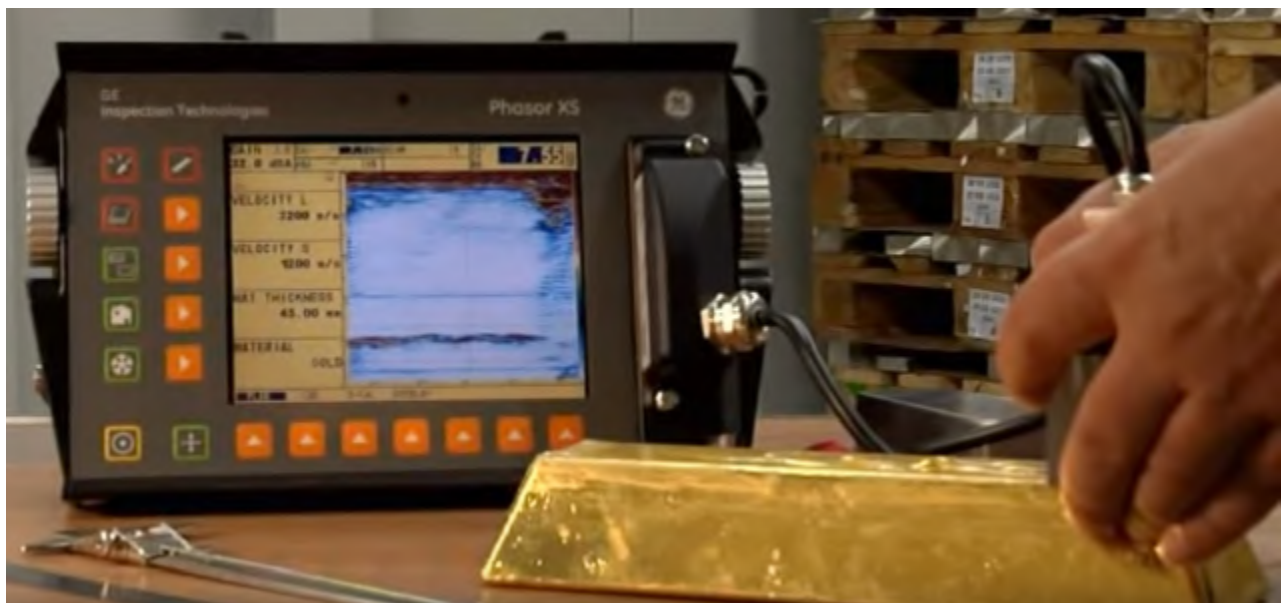
Ultrahangos aranyrúdvastagság-mérő készülék

Amennyiben kisebb mértéket mérünk, akkor az aranyrúd valamilyen szilárd, az arannyal nem elegyedő magot tartalmaz. Ez feltehetően wolframmag lehet, azaz ilyen esetben indokolt az aranyrudat mélyen megfúrni vagy átolvasztani. A wolfram az arannyal nem elegyedik, mert az arany forráspontja 2970 °C, míg a Wolfram olvadáspontja: 3422 °C. Ha viszont az aranyat rézzel ötvözik, akkor 1 kilogramm ötvözet akár 40-50%-kal nagyobb méretű is lehet, mint ami az 1 kg-os színarany rúdra jellemző, hiszen a réz sűrűsége jóval kisebb, mint az aranyé.