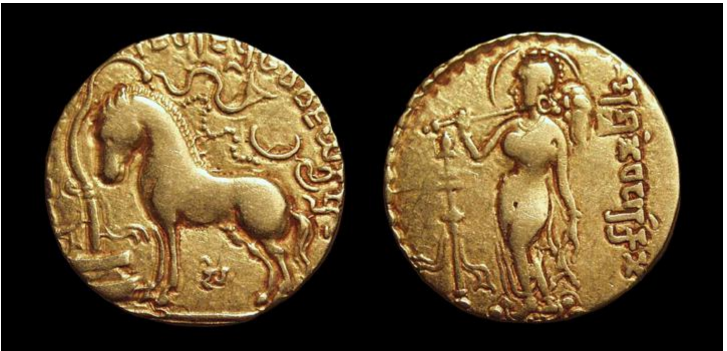
Samudragupta király (335-375) arany pénze az ókori Indiából

Több ezer éves tapasztalat, hogy az arany hosszú távon is megbízhatóan őrzi az értékét. A fizikai arany a generációkon átívelő vagyonmegőrzés kiváló eszköze. Az arany ellenáll az inflációnak, sőt, néhány százalékos reálhozamot is biztosít. Krízishelyzetekben szinte az arany az egyetlen, amely azonnal hordozható érték, és bárhol könnyen beváltható.