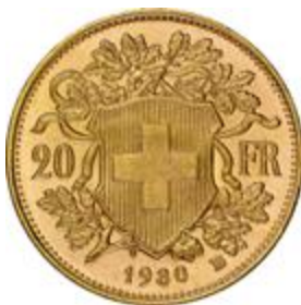
Svájci 20 frankos