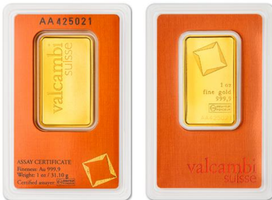
1 unciás Valcambi aranylapka

Nagyon népszerű Valcambi termék még az 1 unciás aranylapka, amely elsősorban kedvező árával és szemgyönyörködtető dizájnjával ér el sikereket.