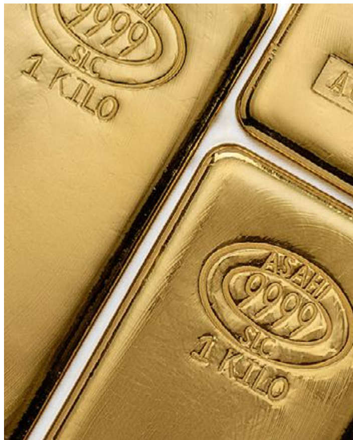
Az Asahi aranyfinomító (USA) 1 kilós aranyrúdja

Európában a svájci gyártók (Argor, Valcambi, Metalor, Pamp), valamint a német Heraeus, illetve a belga Umicore aranyrúd termékei a legnépszerűbbek. Az USA-ban és Kanadában az előbb említett svájci gyártók, valamint az Asahi és a Royal Canadian Mint, Ausztráliában pedig a Perth Mint aranytömbjei a legkeresettebbek.