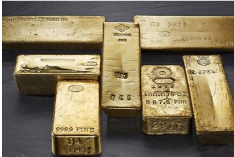
Aranyrudak a Rothschild-gyűjteményből