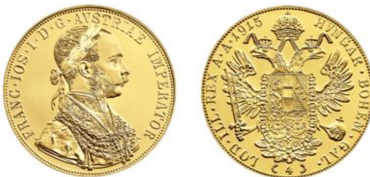
A Münze Österreich által vert, 4 dukátos utánveret

Elsősorban az Osztrák Pénzverde (Münze Österreich) ért el szép sikereket a régi pénzek újravérésével. A régi 1 dukátos, 4 dukátos, a 4 és 8 florinos, valamint a 20 koronás érmék nagy mennyiségben találnak gazdára az egykori Osztrák-Magyar Monarchia területén, ezért a másodpiacon is eléggé alacsony prémiummal forognak, és tipikus befektetési aranyérméknek tekinthetők. A dukátokat 986 ezrelék (23 karátos arany) tisztaságban 1915-ös évszámmal veri a Münze Österreich, és ezek az aranyérmék napjaink egyik legnépszerűbb utánveretei.