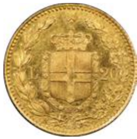
I Umberto olasz líra