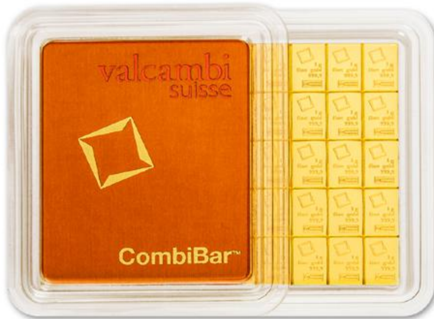
Valcambi CombiBar, népszerű nevén „aranysocki”