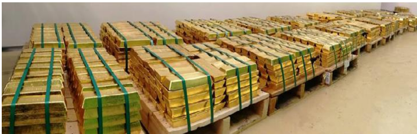
A Magyar Nemzeti Bank aranytartalékának hazaszállításakor készült fotó 28 tonna aranyról