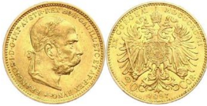
Osztrák-magyar koronastandardba tartozó osztrák 20 koronás aranyérme

Kakukktojás a magyar 100 koronás aranyérme , amelynek az 1908-as dátumú verőtövéét újra felhasználta a Magyar Nemzeti Bank, és egyszeri, jelentősebb mennyiséget vert belőle az 1970-es években, így ezek az ún. „Artex” 100 koronások is alacsony prémiummal vásárolhatóak meg, pedig az eredeti (nem utánvert) 100 koronások a ritka numizmatikai érmék csoportjába sorolhatóak, és 3-4-szeres áron forognak az arany árához képest.