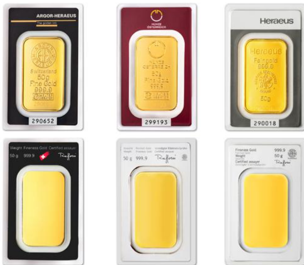
50 grammos Argor, Münze Österreich és Heraeus típusú aranylapkák összehasonlítása

A tulajdonos Heraeus cég is gyártat aranylapkákat és aranyrudakat leánycégével az Argorral. A 2-100 grammos mérettartományban szinte csak a csomagolás színében van különbség az aranylapkák között.