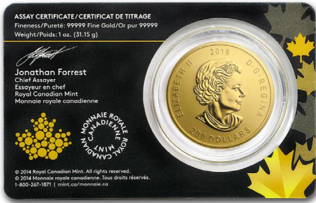
A kanadai Vadon Szava érmesorozat egy 5 kilences sikerszéria a Royal Canadian Minttől