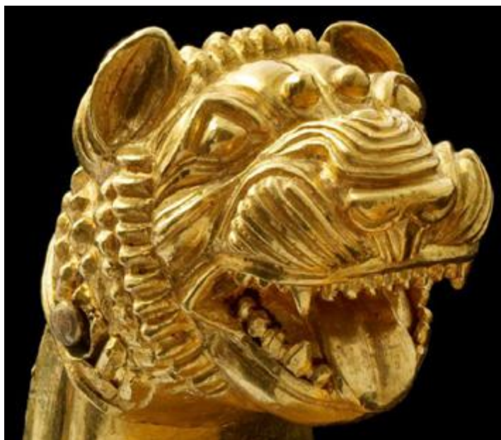
Tigrist ábrázoló arany karpereceg a párizsi Louvre-ban