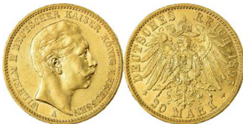
Victoria brit sovereign, Wilhelmina 10 holland gulden és II. Wilhelm 20 márka