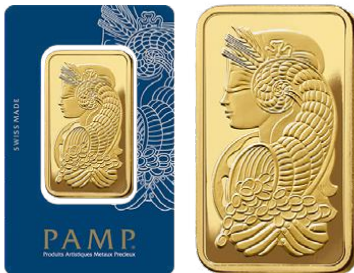
100 grammos Pamp gyártmányú „Fortuna” aranyrúd

A Pamp nevű, méltán világhírű, svájci gyártó egyik legnépszerűbb terméke a „szerencsehozó” Fortuna lapka.