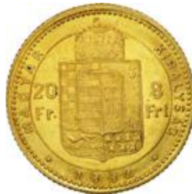
Magyar 8 forint

A Latin Érmeunió pénzeinek egy csoportja