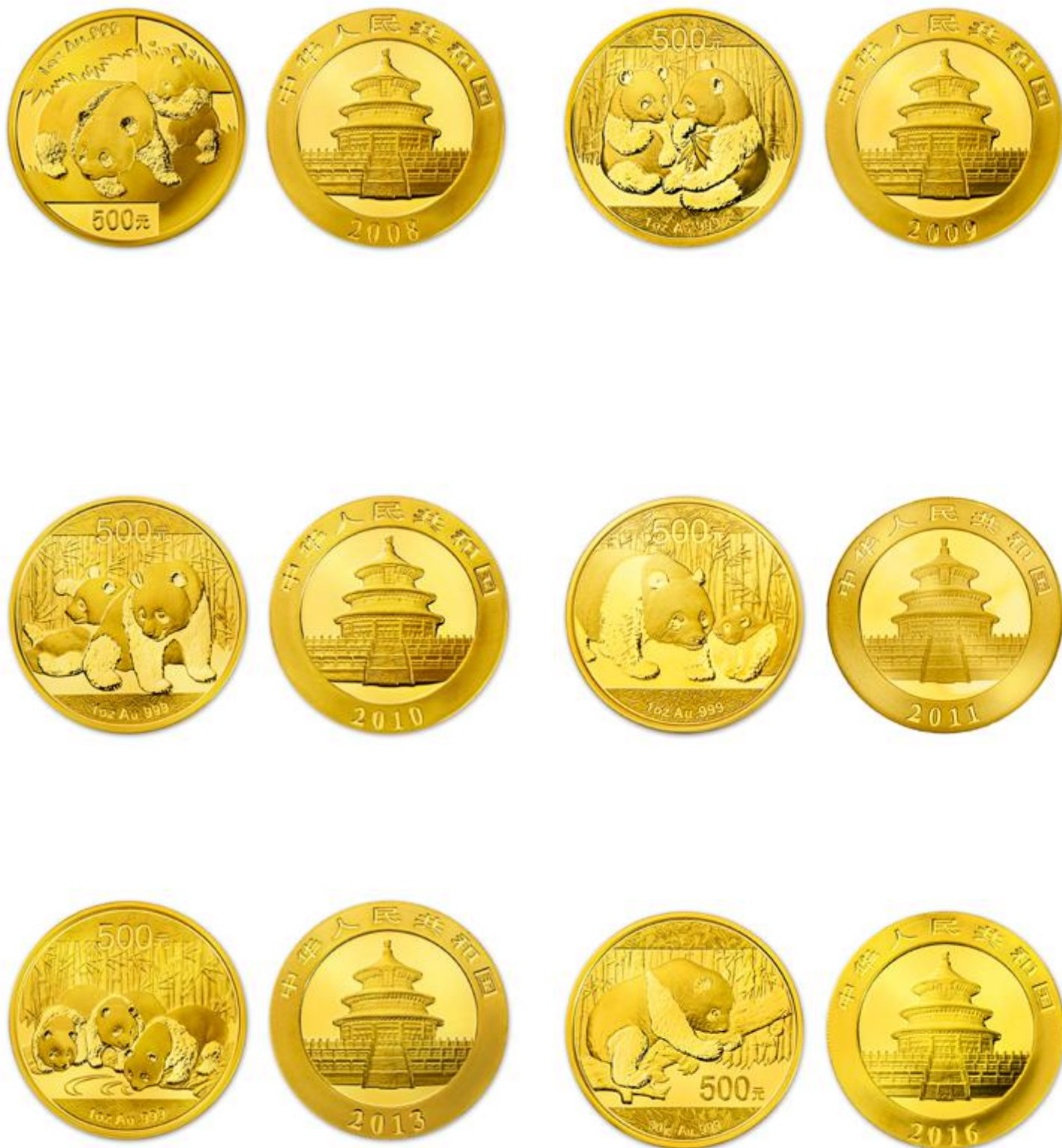
Panda érmesorozat