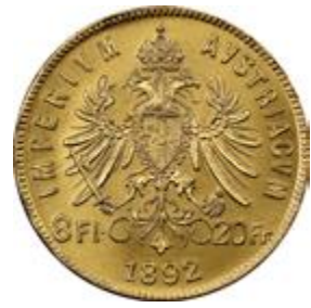
Oszták 8 florin