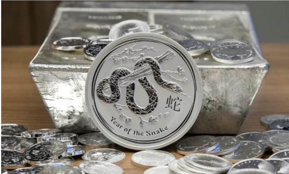
15 kilós befektetési ezüstrúd és befektetési ezüstérmék

A többi termékhez, szolgáltatáshoz hasonlóan a nemesfémek kereskedelme is egyre inkább az interneten zajlik. Természetes, hogy az ügyfél egyetlen számla nyitásával szeretne hozzáférni az összes nemesfém szolgáltatáshoz, és az is jogos elvárás, hogy mindezt bármikor, kényelmesen, otthonról tehesse meg, valamint, hogy minden lényeges adatot és dokumentumot valós időben láthasson.