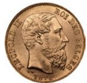
Belga 20 frankos