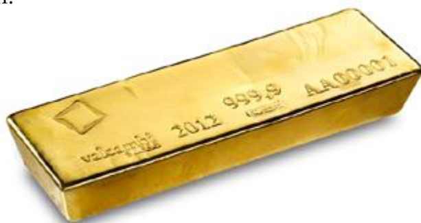
400 unciás Valcambi típusú aranytömb

A nagykereskedők, finomítók és a jegybankok közti aranszámla elszámolások és aranykölcsönök fedezetéül is jellemzően 400 unciás Good Delivery tömböket tárolnak Londonban vagy más nagy aranyközpontokban.