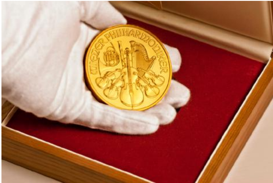
A legnagyobb Bécsi Filharmonikus, a 20 unciás emlékérmé

Az 1 unciás befektetési aranyérmék mellett, mindegyik nagy márkanevből vernek kisebb érméket is. A befektetési érmesor 1/20 vagy 1/10 unciával kezdődik, és 1 unciával végződik. A Kenguru ebből a szempontból kivétel, mert abból vernek 1000 grammos befektetési aranyérmét is.