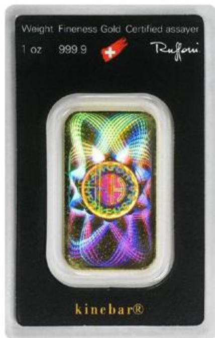
Argor aranyrudak Kinebar technológiával