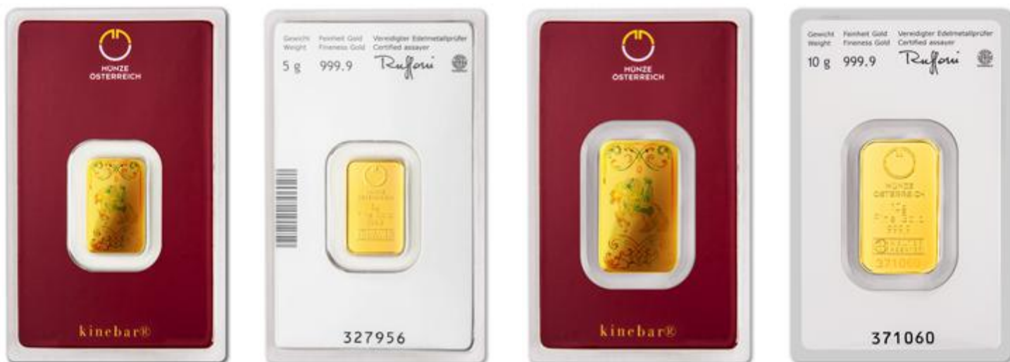
A bécsi lovasiskola motívumai az Argor által gyártott Münze Österreich aranylapkákon

Az alábbi példában a Kinebar technológia inkább az aranylapka felszínének díszítésére szolgál, ezáltal színarany ajándéknak szokták vásárolni.