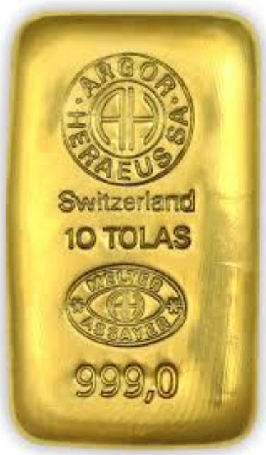
Az Argor által gyártott 10 tola súlyú aranytömb

Néhány országban öntenek 100 unciás (3110,3 grammos) aranytömböket is, illetve léteznek más mértékegység szerint öntött rudak is, például az Indiában és Nepálban az ókortól kezdve napjainkig használatos tola súlymértékben (11,6639 gramm) kifejezett rudak, vagy pedig Kínában a tael mértékegységű rudak, amelyek súlya 37,5 gramm.