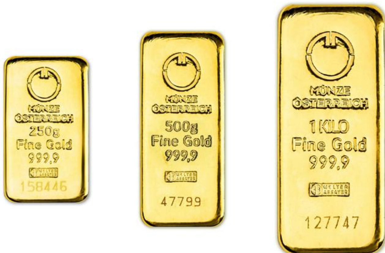
A Münze Österreich aranyrúd szortimentje: 250-1000 grammos aranytömbök

A Münze Österreich típusú 250 grammos aranyrudaktól kezdődően viszont fontos különbség, hogy míg az Argor és a Heraeus típusú rudakhoz gyárilag jár certifikát (egy tanúsítvány), addig a Münze Österreich típusú rudakhoz nem. Emiatt az utóbbi adásvétele és tárolása némileg kényelmesebb.