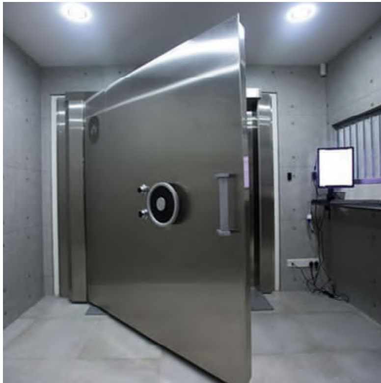
A saját páncélterem kialakítása nagy költségekkel jár

Azt sem árt felmérni, hogy a cég üzleti modellje egyáltalán tartalmaz-e akkora árrést, hogy a cégnek megérje aranytárolással foglalkoznia. A trezor kialakításának költségével nem is számolva: legalább éves 3 ezreléknyi díjat be kell szednie a szolgáltatónak, hogy minimális nyereségre tehesen szert. Ezért azon cégek, amelyek ennél kevesebbet kérnek, vagy „kamatot” ígérnek az aranyát betároló ügyfélnek, kerülendőek.